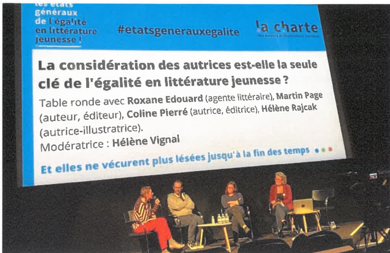
La Charte des auteurs et illustrateurs jeunesse a organisé, lundi 5 octobre, les Etats généraux de l'égalité en littérature jeunesse.