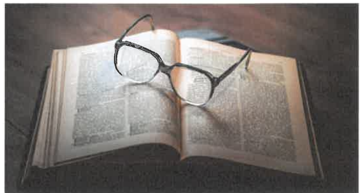
LA LECTURE EN BAISSÉ LORS DU 1ER CONFINEMENT EN 2020 SELON UNE ÉTUDE DU GOUVERNEMENT

rapport à 2018 auprès des Français, dévoile une étude du Ministère de la Culture, publiée le 13 décembre.